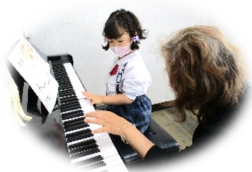
ピアノ教室、エレクトーン教室