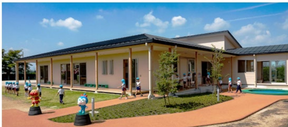
〈0～1歳児保育室・給食設備を整えた新園舎〉

これまでも、これからも子どもたちにとって一番便利な、一番楽しい、一番安心できる地域一番のこども園になることを目標に、日々、進化してまいります。