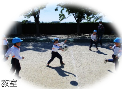
体操・サッカー教室