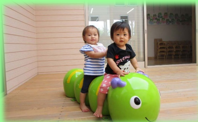
パティオ棟の中庭で遊ぶ0歳児

子どもたちがこのパティオ(スペイン語で中庭の意味)の中で遊びながら、光と風と触れ合うすてきな空間